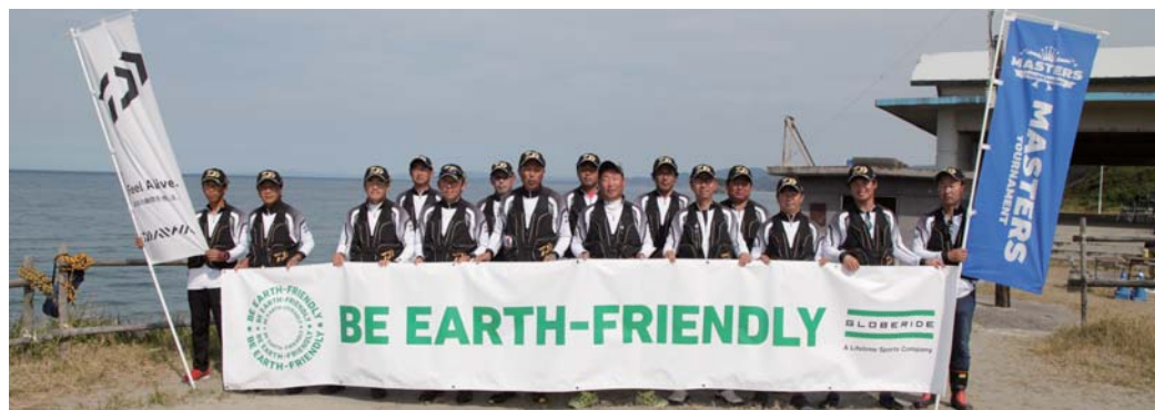
2019年度 ダイワキスマスターズ 全国決勝大会 出場15選手(鹿児島県・薩摩川内市/唐浜)