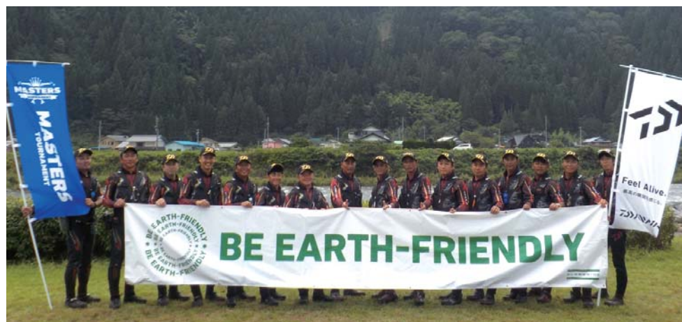
ダイワ鮎マスターズ2019 全国決勝大会 出場16選手(岐阜県・長良川)

決勝トーナメントに出場出来なかった選手はシード権争奪戦に出場します。シード権争奪戦第1位から3位の選手は、翌年最寄のブロック大会「決定戦」にシードされます。第4位から12位の選手は、翌年最寄のブロック大会「予選」にシードされます。また、前年度全国決勝大会優勝選手が今年度全国決勝大会で決勝トーナメントに出場できなかった場合は、翌年最寄のブロック大会「決定戦」にシード選手として登録されます。