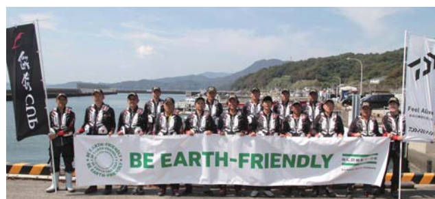
2019年度 第4回ダイワ銀狼カップ2019 全国決勝大会 出場16選手 (熊本県上天草市/樋島)